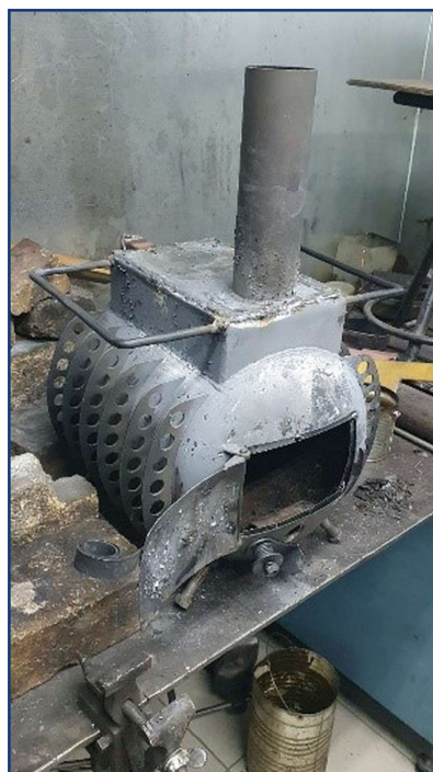
Наши сотрудники принимают участие в изготовлении таких печурок для участников СВО.

детский лыжный праздник на нашей базе, пополнен спортивным инвентарем прокат (горные, беговые лыжи, шлемы, ботинки, палочки лыжные, тренажеры и т.д.), проведены лыжные соревнования, состязания по мини-футболу, теннису, шахматам и др., частично компенсированы стоимость билетов в театры, на концерты, за путешествия на Алтай и другие города, частично компенсированы путевки в санатории (от профсоюза и администрации на основании колдоговора).