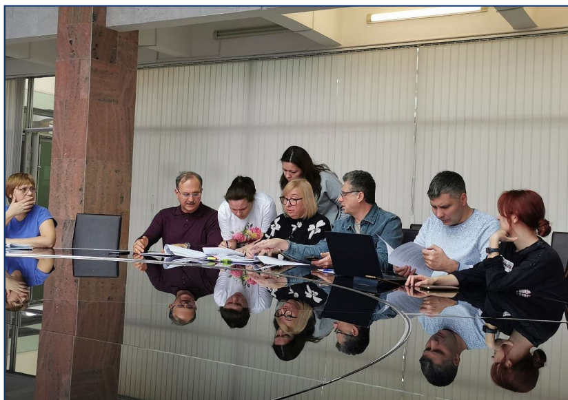
Обсуждение колдоговора двусторонней комиссией за круглым столом ИЯФ.

После переговоров профсоюза и администрации нашего института принят новый коллективный договор, который будет действовать три года (до 2026 года). В нем обозначены обязательства обеих сторон. Например, при самостоятельном приобретении путевки в санатории члены профсоюза получают компенсацию 15 тыс. рублей от администрации и 6 тыс. рублей от профсоюза. При рожде-