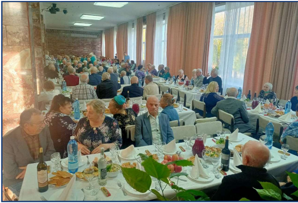
Вечер для неработающих ветеранов ИЯФ.

нии ребенка — 25 тыс. рублей от администрации и 5 тыс. рублей от профсоюза, и многое другое (колдоговор выложен на сайте профсоюза ИЯФ).